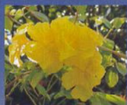
コガネノウゼン(イペー)