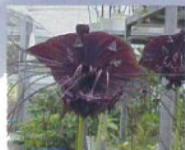
ブラックキャット