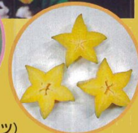
ゴレンシ (スターフルーツ)