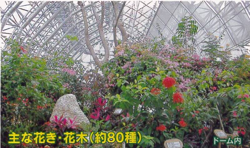
主な花き・花木(約80種)