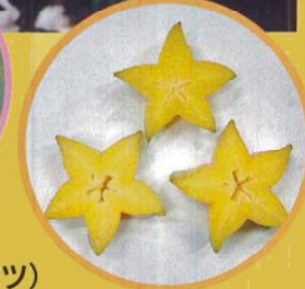
ゴレンシ (スターフルーツ)